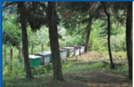
ხანდაზმულთა სახლის „მამულები“ და მეურნეობა