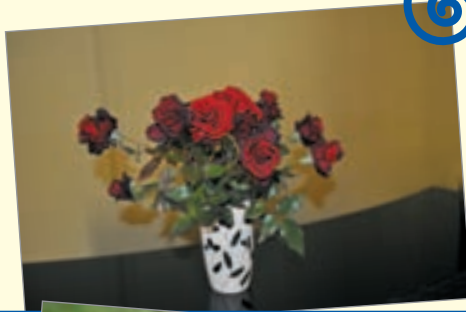
ვარდები ხანდაზმულთა სახლის ბაღიდან

სახლის თანამშრომელთა უმრავლესობას აქვს ექთნის კვალიფიკაცია. პერსონალს სისტემატურად უტარდება საკვალიფიკაციო ტრენინგები ბენეფიციართა მომსახურების გასაუმჯობესებლად.