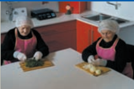
სახლის ბინადრები სამზარეულოში – მზარეულის მოხალისე ასისტენტები